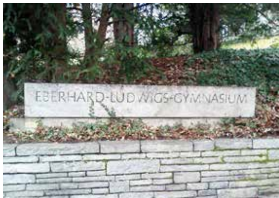
Das Eberhard-Ludwigs-Gymnasium am Herdweg wurde 1954 auf dem Gelände der ehemaligen Villa des Grafen von Zeppelin errichtet. Für das denkmalgeschützte Gebäude erhielt Architekt Hans Bregler 1959 den Paul-Bonatz-Preis.